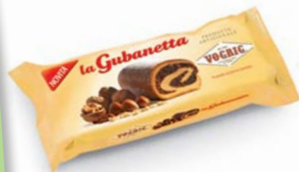
LA GUBANETTA Flow Pack - 400 g Prodotto tipico regionale a base di pasta lievitata con ripieno di frutta secca. Typical regional leavened baked cake with nut filling.