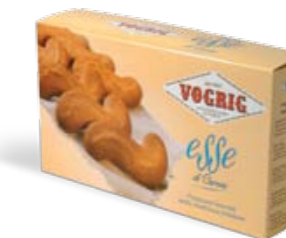
ESSE DI CARNIA Scatola/Box - 230 g Fragranti biscotti della tradizione friulana. Fragrant biscuits from "tradizione friulana".