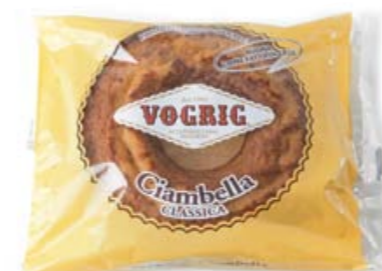
CIAMBELLA CLASSICA Flow Pack - 400 g Prodotto a base di pasta colata dalla tipica forma di ciambella all'aroma di limone. Dough-based lemon- flavoured cake in the typical doughnut shape.