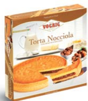
TORTA NOCCIOLA Scatola/Box - 450 g Torta a base di pasta frolla con crema alla nocciola. Short pastry cake with hazelnut cream.