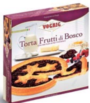
TORTA FRUTTI DI BOSCO Scatola/Box - 400 g Torta a base di pasta frolla con farcitura ai frutti di bosco. Short pastry cake with a filling of forest fruit.