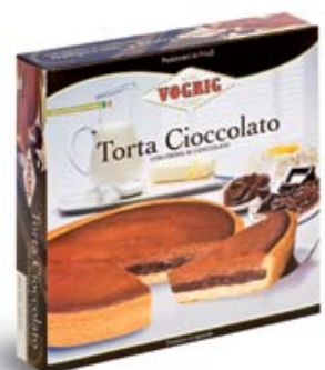
TORTA CIOCCOLATO Scatola/Box 450 g Torta a base di pasta frolla con crema al cioccolato. Short pastry cake with chocolate cream.