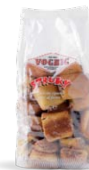
STRUKY Flow Pack - 500 g Dolcetti ripieni cotti al forno. Baked stuffed pastries.