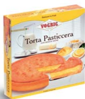
TORTA PASTICCERA Scatola/Box - 450 g Torta a base di pasta frolla con crema al limone. Short pastry cake with lemon cream.