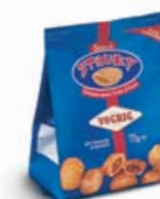
STRUKY Flow Pack - 75 g Dolcetti ripieni cotti al forno. Baked stuffed pastries.