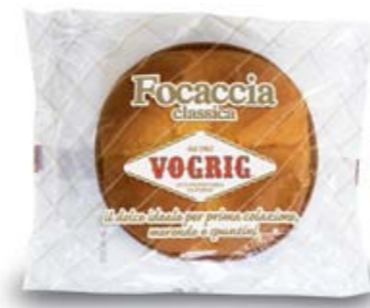
FOCACCIA CLASSICA Flow Pack - 400 g Tipica focaccia dolce a base di pasta lievitata. Typical leavened sweet Focaccia cake.