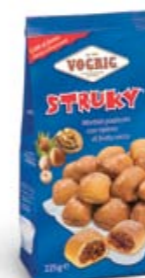
STRUKY Flow Pack - 225 g Dolcetti ripieni cotti al forno. Baked stuffed pastries.