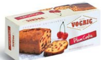
PLUM CAKE Scatola/Box - 400 g Prodotto da forno con ciliegie candite ed uvetta. Baker product with candied cherries and raisins.