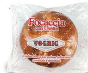
FOCACCIA CON UVETTA Flow Pack - 400 g Tipica focaccia dolce a base di pasta lievitata con uvetta. Typical leavened sweet Focaccia cake with sultana.