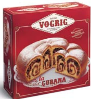
LA GUBANA Scatola rossa/Red box - 850 g Prodotto tipico regionale a base di pasta lievitata con ripieno di frutta secca. Typical regional leavened baked cake with nut filling.