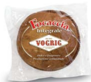
FOCACCIA INTEGRALE Flow Pack - 400 g Tipica focaccia dolce a base di pasta lievitata con farina integrale. Typical leavened sweet Focaccia cake with wholemeal flour.