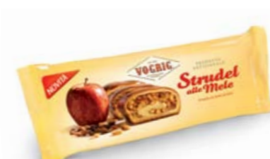
STRUDEL ALLE MELE Flow Pack - 300 g Prodotto a base di pasta lievitata con farcitura alle mele. Leavened cake with apple filling.