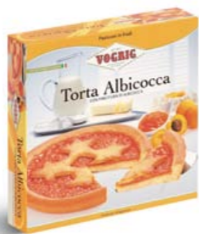
TORTA ALBICOCCA Scatola/Box 400 g Torta a base di pasta frolla con farcitura di albicocca. Short pastry cake with apricot filling.