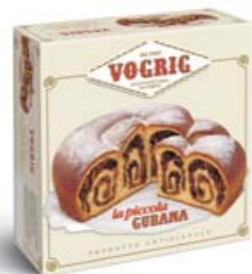
LA PICCOLA GUBANA Scatola/Box - 450 g Prodotto tipico regionale a base di pasta lievitata con ripieno di frutta secca. Typical regional leavened baked cake with nut filling.