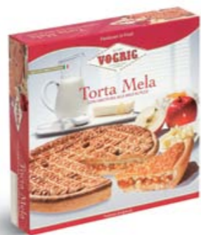
TORTA MELA Scatola/Box - 500 g Torta a base di pasta frolla con farcitura alle mele in pezzi. Short pastry cake with a filling of apples in pieces.